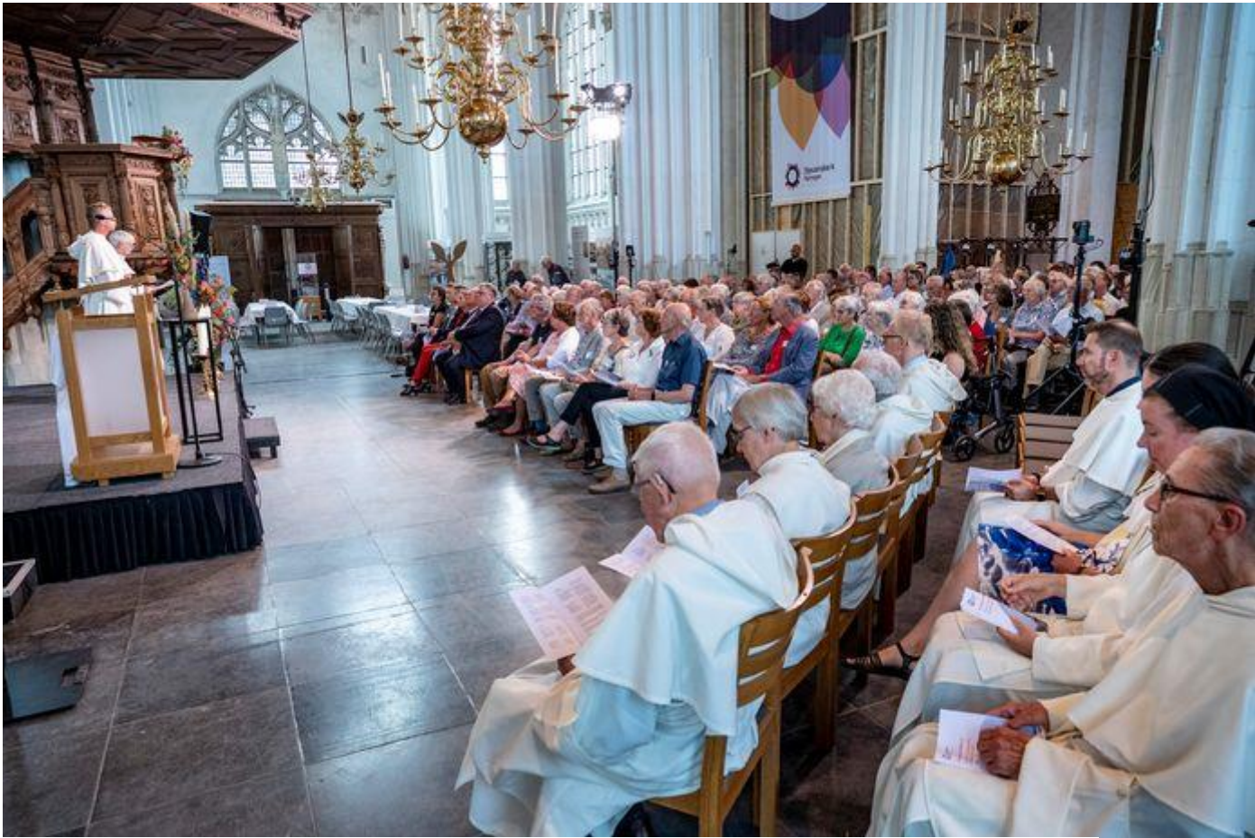
Dominicaner kloosterlingen bij de viering van het 750-jarig jubileum van de Stevenskerk. Zij eren met hun aanwezigheid bisschop Albertus Magnus die in 1272 de kerk wijdde.

In de vijftiende eeuw, een periode die voor Nijmegen een bloeitijd was, kreeg de Stevenskerk de uitstraling van een kathedraal door uitbreiding met een koor en kapellen. Van binnen rijk versierd met afbeeldingen die de bevolking de wereldorde uitlegden en hoe te leven. Tot de beeldenstorm in de zestiende eeuw, toen de kerk werd overgenomen door de protestanten. Maar ook voor deze religie was de kerk een huis van troost en bezinning.