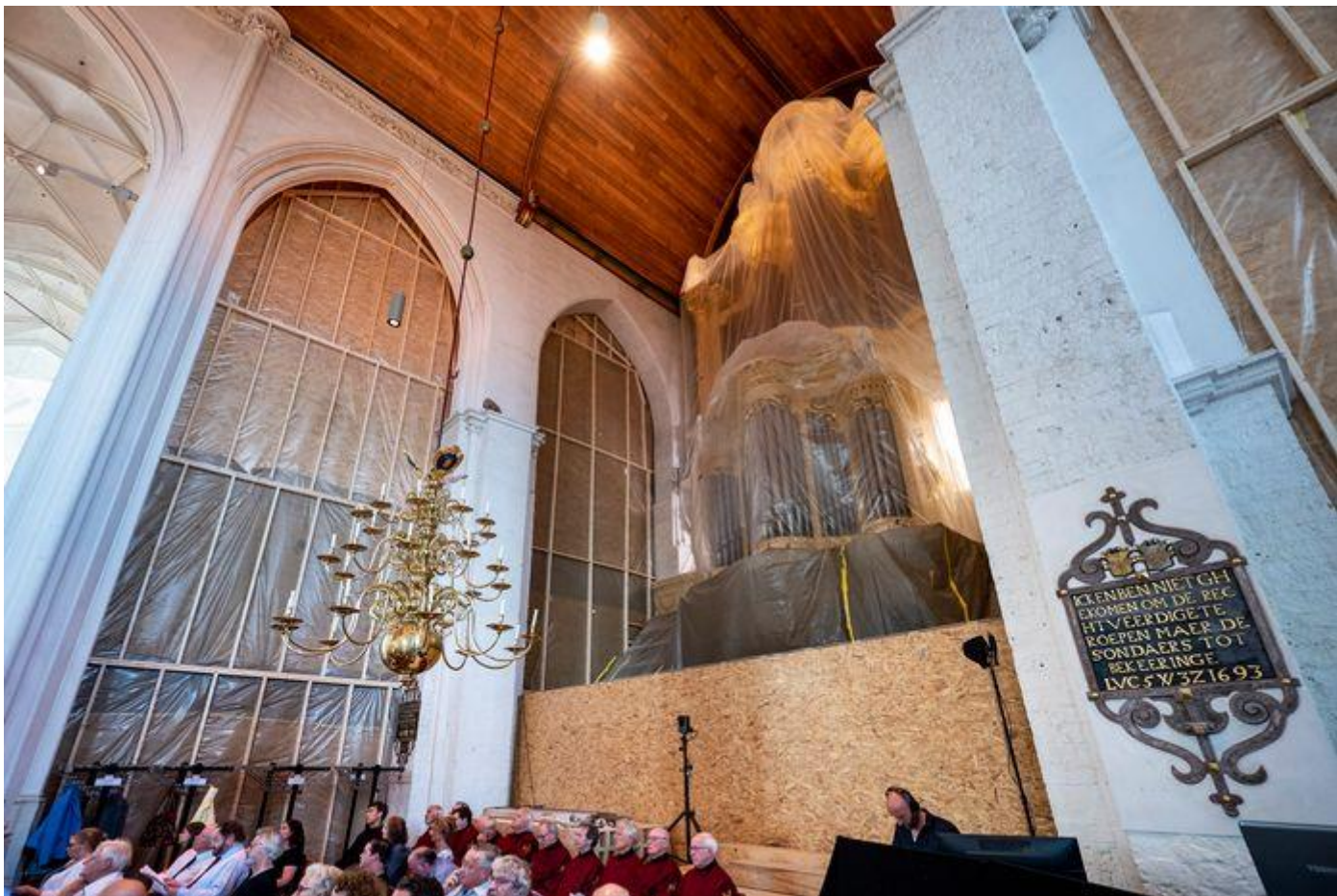
Een deel van de kerk is ingepakt in verband met een grootscheepse renovatie.

Het feestjaar duurt tot 7 september 2023.